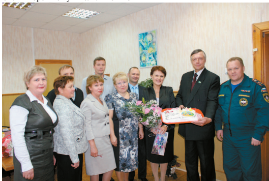
На снимке: Подарок Управлению образования от представителей профкома.

Материал подготовила Елена Кучина, информационная комиссия