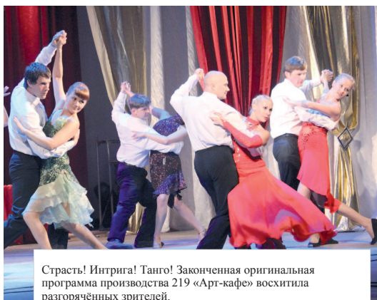
Страсть! Интрига! Танго! Законченная оригинальная программа производства 219 «Арт-кафе» восхитила разгорячённых зрителей.