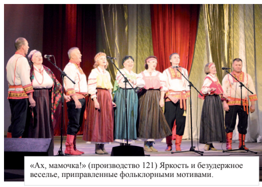
«Ах, мамочка!» (производство 121) Яркость и безудержное веселье, приправленные фольклорными мотивами.