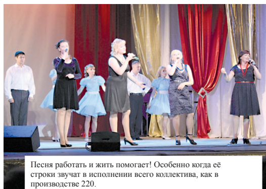
Песня работать и жить помогает! Особенно когда её строки звучат в исполнении всего коллектива, как в производстве 220.