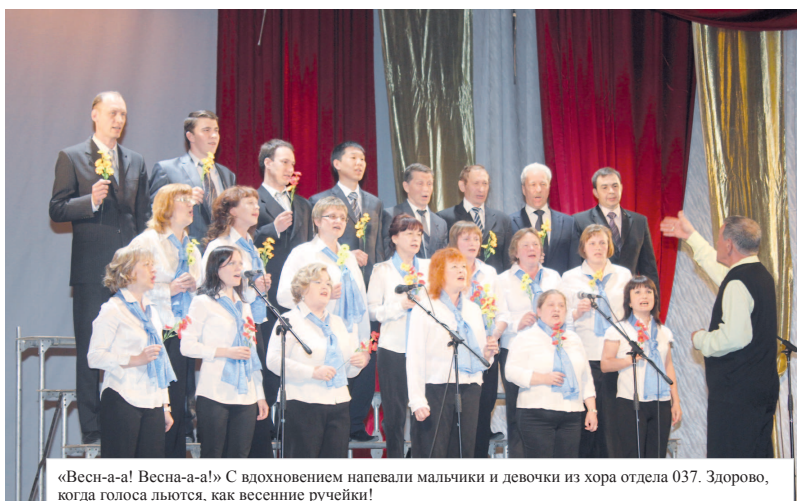
«Весна-а-а! Весна-а-а!» С вдохновением напевали мальчики и девочки из хора отдела 037. Здорово, когда голоса льются, как весенние ручейки!