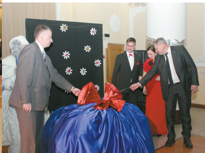
«Что же там спрятано?» В каждом взрослом человеке живёт маленький ребёнок, который никогда не перестаёт верить в сказку и ждать чудес.