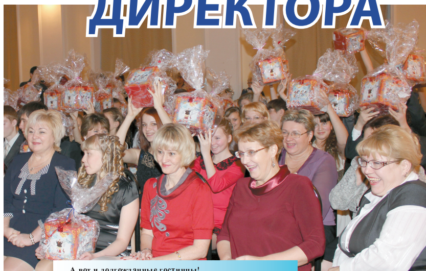
А вот и долгожданные гостицы!