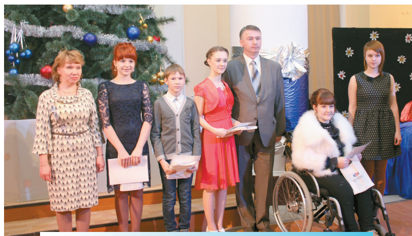
У юных звёздочек из разных школ останутся на память снимки с королём бала.