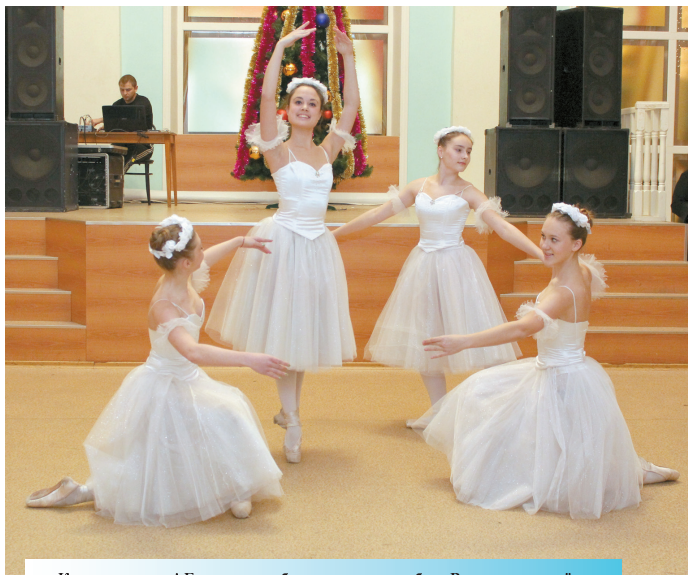
Конечно, танец! Без него не обходится ни один бал. Воздушные и лёгкие, как настоящие снежинки, балерины закружили всех в вихре праздника.