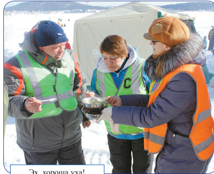
Эх, хороша уха!