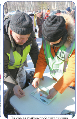
Та самая рыбка-победительница.