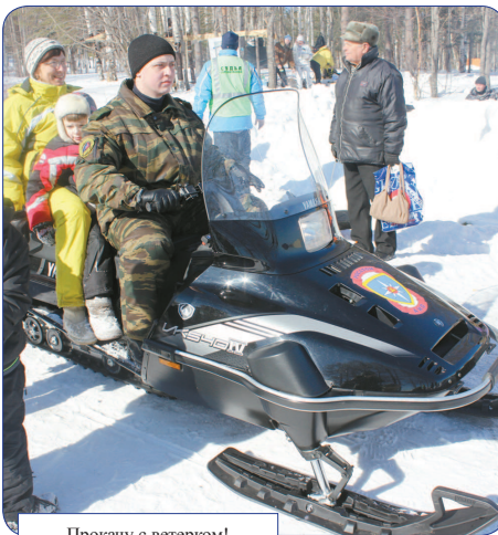
Прокачу с ветерком!