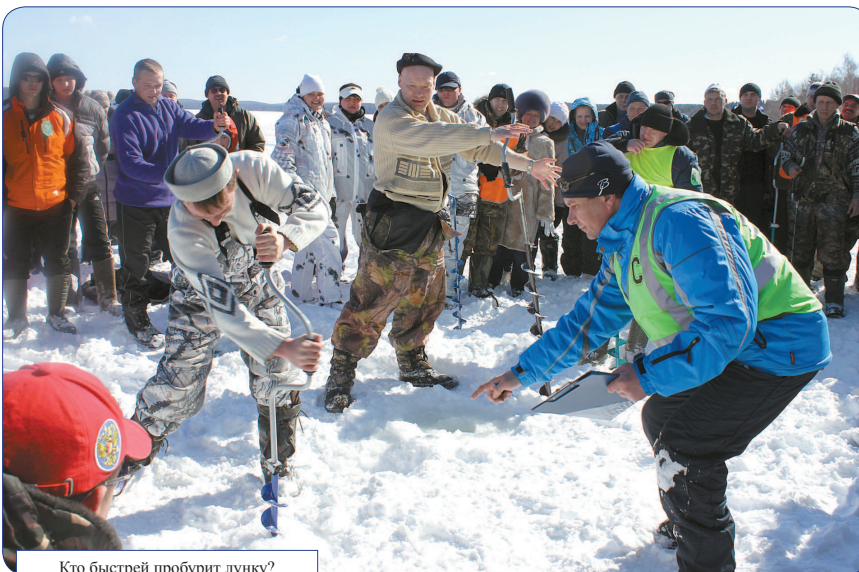
Кто быстрее пробурит лунку?