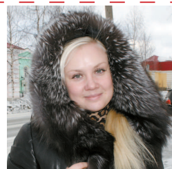
приятно получить трогательный руковорный подарок.

— Любимый праздник — Восьмое марта. Это поистине замечательный весенний день. У всех вокруг солнечное настроение. Мужчины уделяют много внимания девушкам, дарят интересные подарки и красивые букеты. Самое чудесное 8 марта было у меня в 2012 году. Я ходила к своему ребёнку на утренник. Там детишки пели, танцевали, рассказывали стихи, а ещё они смастерили для мам симпатичные бумажные вазочки с цветами. Было очень