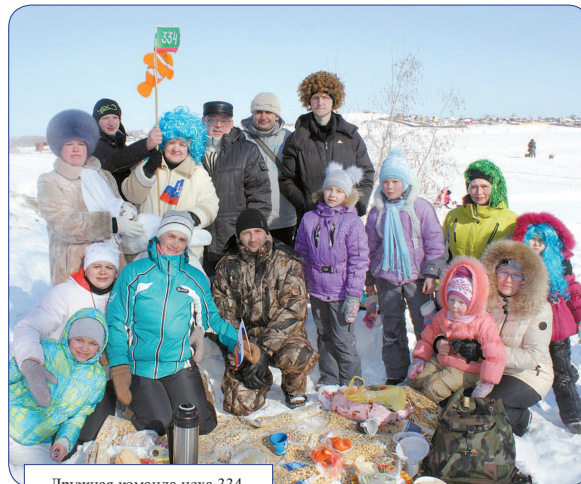
Дружная команда цеха 334.