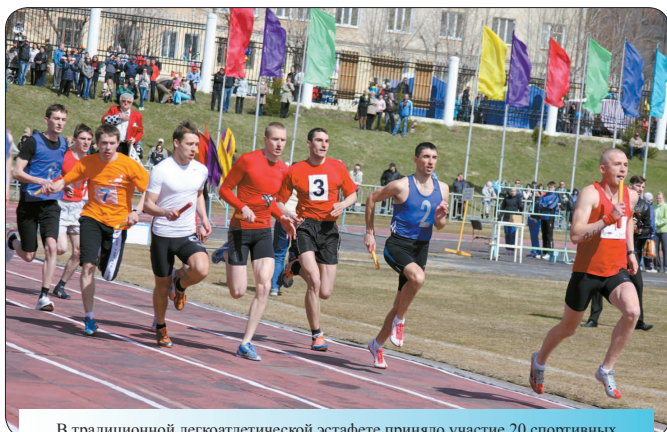
В традиционной легкоатлетической эстафете приняло участие 20 спортивных команд комбината «Электрохимприбор». В забеге сильнейших в сороковой раз одержала победу команда «Авангард» (производство 435), 2 место заняла команда «Прометей» (МЧС России), 3 место – команда «Спартак» (ХТП-220), 4 место – команда «Комета» (СП-219), 5 место – команда «Знамя» (УК), 6 место – команда «Темп» (отдел 037).