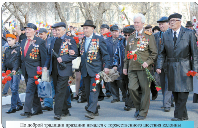
По доброй традиции праздник начался с торжественного шествия колонны ветеранов по улицам Лесного. На протяжении всего пути к ним подходили жители города и дарили цветы в знак уважения и благодарности.

9 мая по всей России отмечался священный праздник – День Победы советского народа в Великой Отечественной войне 1941-1945 годов. Мероприятия, посвящённые этому великому историческому событию, прошли и в Лесном.