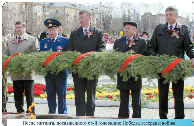
После митинга, посвящённого 68-й годовщине Победы, ветераны войны, представители администрации Лесного, комбината «Электрохимприбор», профсоюзной организации предприятия и силовых структур города возложили венки к Вечному огню.