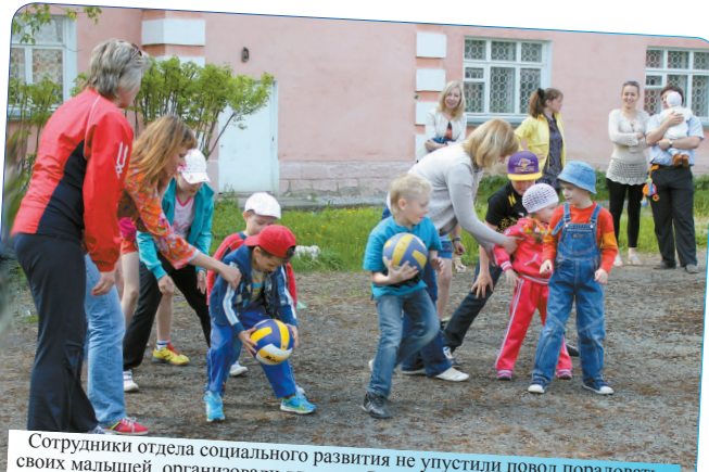
Сотрудники отдела социального развития не упустили повод порадовать своих малышей, организовали для них «Весёлые старты». После азартного соревнования ребята получили сладкие подарки и дружно принялись раскрашивать асфальт цветными мелками.