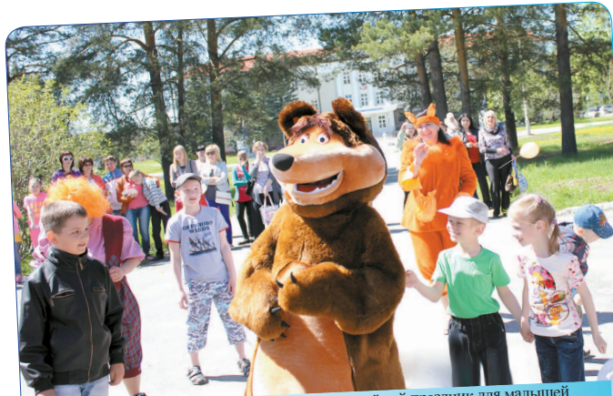
Работники заводоуправления устроили весёлый праздник для малышей на площадке перед столовой № 911. Ребятам развлекали зазорный Паровозик из Ромашково, озорной Карлсон, хитрая Лиса и другие герои мультфильмов. Дети танцевали, играли с мячом, отгадывали загадки и рисовали на асфальте мелом.

Во многих подразделениях комбината есть традиция – поздравлять детей первого июня. И в этом году детишки работников комбината отдыхали и веселились от души.