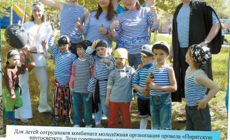
Для детей сотрудников комбината молодёжная организация провела «Пиратскую кругосветку». Дети соревновались в силе, ловкости и находчивости. Каждый юный «пират» получил призы из сундука.

«Вести ФГУП «Комбинат «Электрохимприбор»»