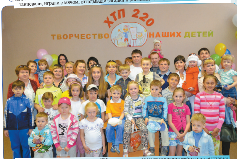
Детишки работников производства 220 представили свои творческие работы на выставку в УВЦ. Более 50 рукодельных работ, акварелей, аппликаций и других поделок порадовали родителей и гостей.