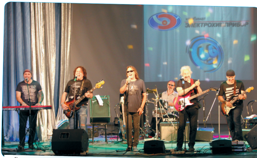
«Гранет спасённый любовью оркестр в божественной тишине». Группа «Цветы» «взорвала» публику.