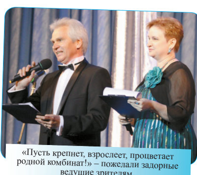
«Пусть крепнет, взрастет, процветает родной комбинат!» – пожелали зазорные ведущие зрителям.