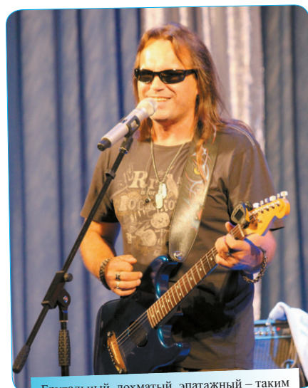
Брутальный, лохматый, эпатажный – таким и должен быть истинный рок-музыкант.