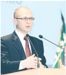
Сергей Кириенко: «За комбинат я спокоен»

О визите главы «Росатома» в Лесной читайте на стр. 3