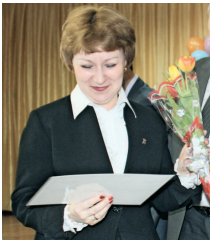
Новые образовательные горизонты

О визите главы «Росатома» в Лесной читайте на стр. 3