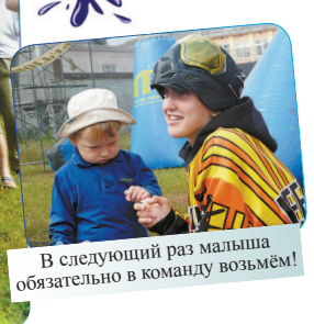
В следующий раз малыша обязательно в команду возьмём!

Информационный центр Фото Алексея Поскрёбышева и Ульяны Быковой