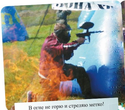
В огне не горю и стреляю метко!

Организаторами красочного состязания выступил пейнтбольный клуб «С-45» при финансировании ФГУП «Комбинат «Электрохимприбор». В первый день сражение проходило среди 23 команд, восемь из которых вышли в финал: «Мотор» (013), «Зенит» (032, 066), «USB» (024), «Металлист» (004), «Спартак» (220), «Пирания» (женская сборная), «Скат» (042), «Пламя» (343). Именно между ними и были разыграны медали и кубки. 1 место заняла команда «Спартак», 2 место – команда «Мотор», 3 место – команда «USB», 4 место – команда «Металлист».