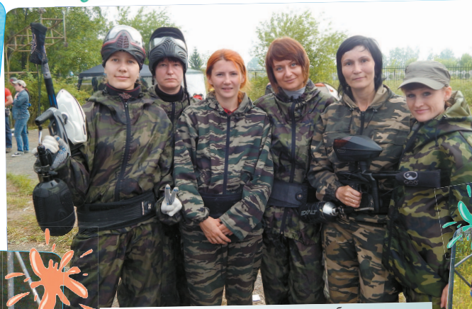
Приятный сюрприз для участников и болельщиков соревнования – очаровательные «Пирани»