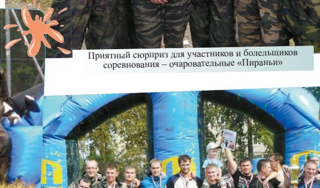
Приятный сюрприз для участников и болельщиков соревнования – очаровательные «Пирани»