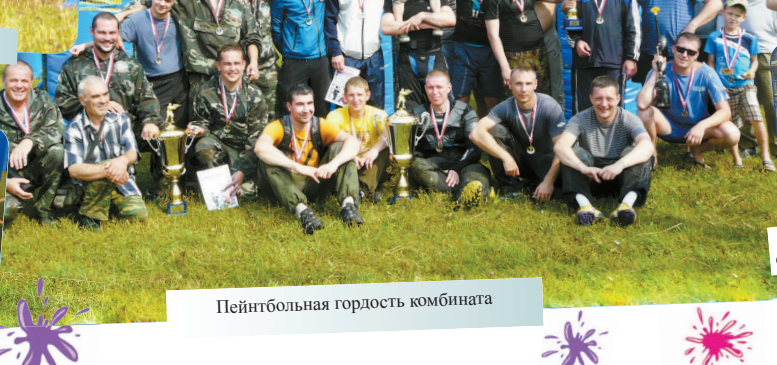
Пейнтбольная гордость комбината