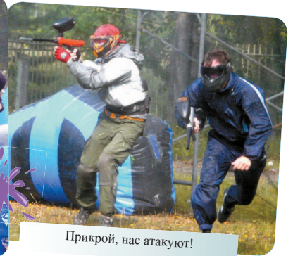
Прикрой, нас атакуют!