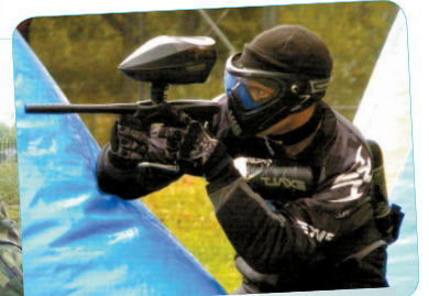
Вижу цель. Открываю огонь!