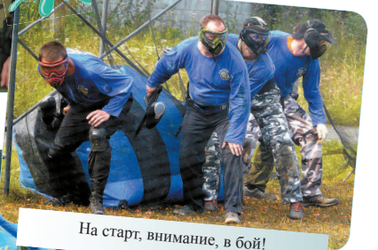
На старт, внимание, в бой!