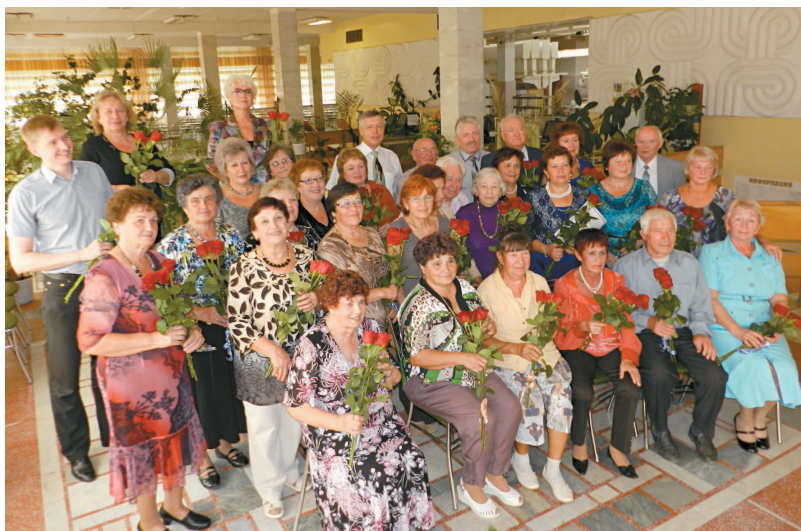
СЛАВИМ ЧЕЛОВЕКА ТРУДА